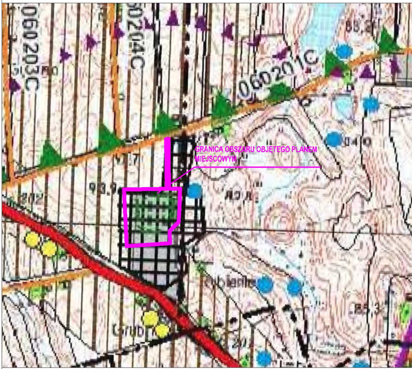
Studium Uwarunkowań i Kierunków Zagospodarowania Przestrzennego Gminy Stolno Skala 1:10 000

SKALA 1:1000 Powierzchnia obszaru objętego opracowaniem - ok. 5,51 ha